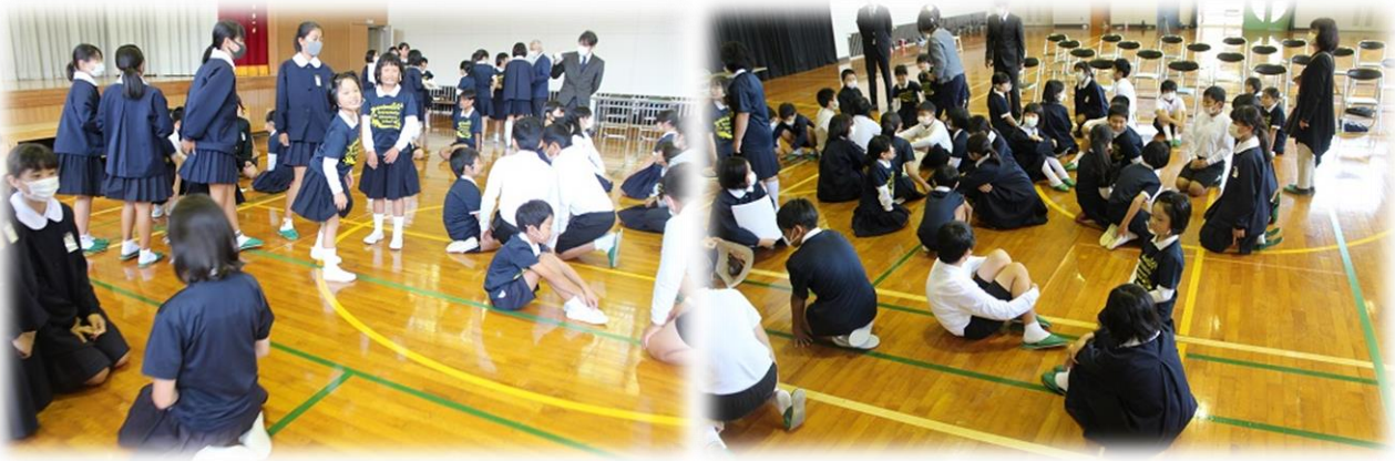
クイズやプレゼンでそれぞれの町を紹介し合い、すぐに打ち解けて笑顔いっぱいの子どもたち