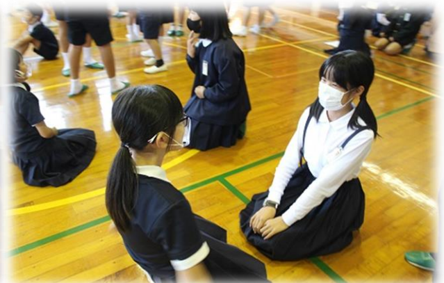
1年生から6年生まで全21名の子どもたちが美しい歌声で6年生を歓迎！