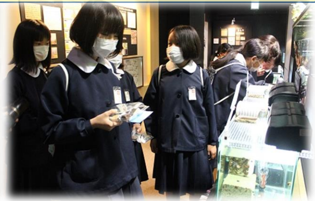
ホタルだけでなく、ありとあらゆる昆虫や不思議な生き物に出会うことができました！