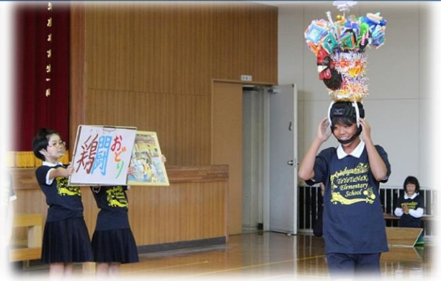
残念ながら今年度末で閉校となる「下関市立豊田中小学校」との交流会