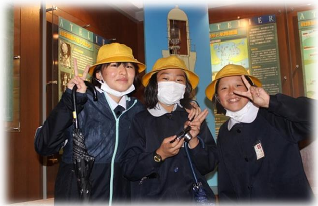
(下関市)「角島大橋・灯台」…小雨ときどき突風にも負けず展望台(灯台)へ