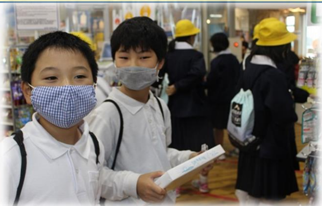
家族、親戚、近所の人顔を思い出しながら楽しそうにお買い物