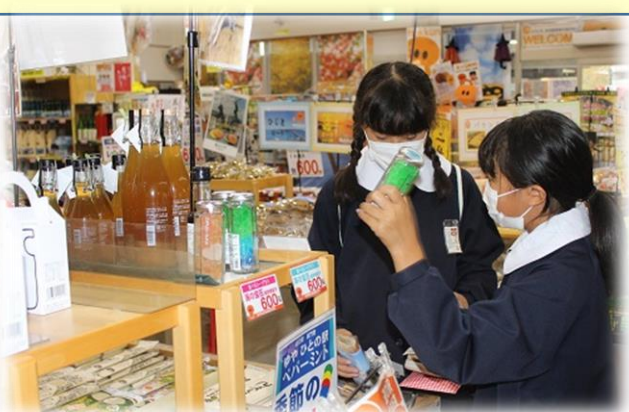
予定を変更して2018年道の駅ランキング全国1位の「道の駅北浦街道豊北」へ