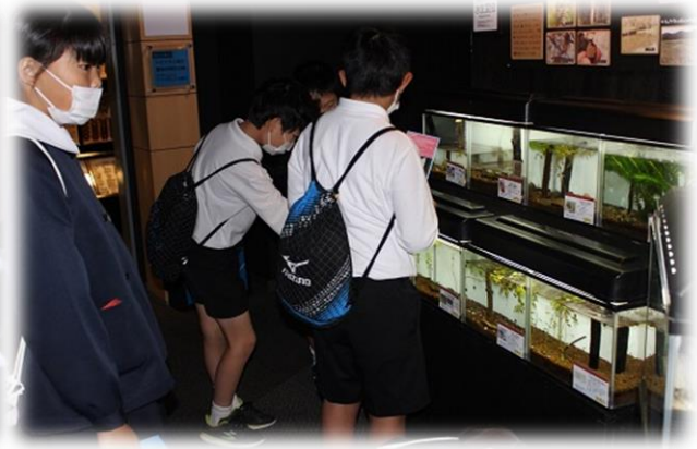
「豊田ホタルの里ミュージアム」にて全国的に著名な学芸員さんの講義を拝聴