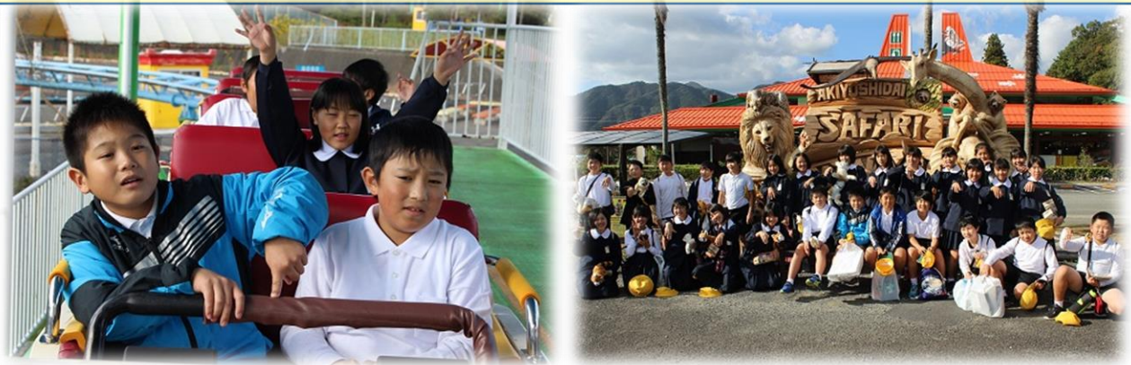
「ナイター観戦」は叶いませんでしたが、満足度100%の修学旅行となりました！