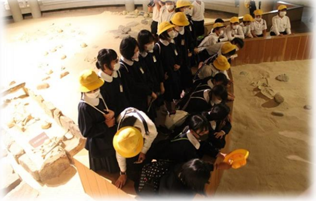
学芸員さんから「話をよく聞いてくれて嬉しかった」とほめられました！