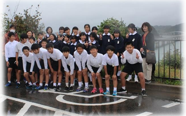
エメラルドに輝く美しい海が見えるはずだった角島大橋往復の旅