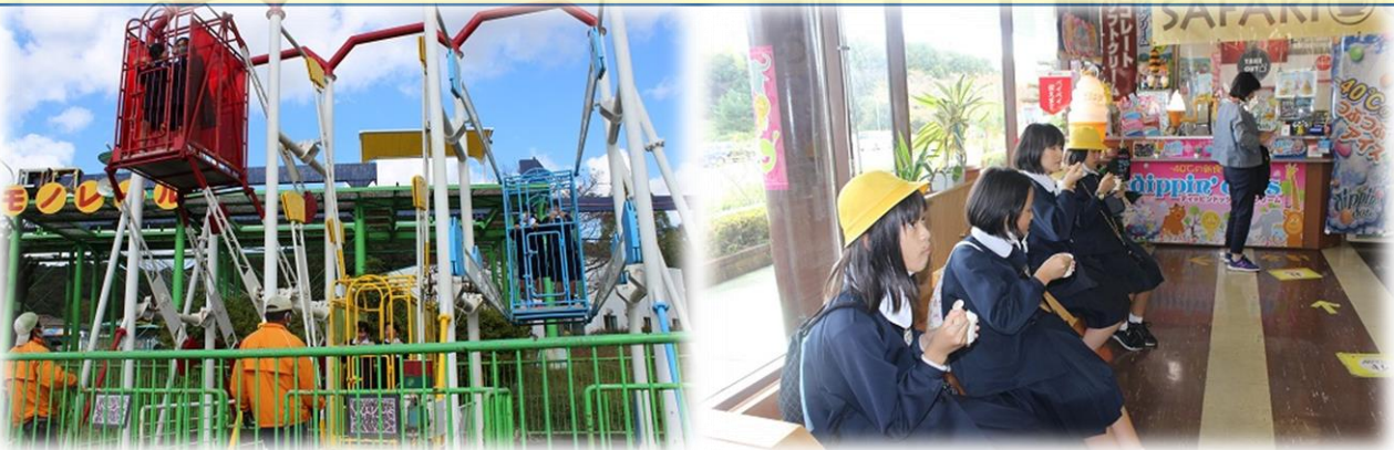
最後のお楽しみ「秋吉台サファリランド」(美祢市美東町)で自由な時間