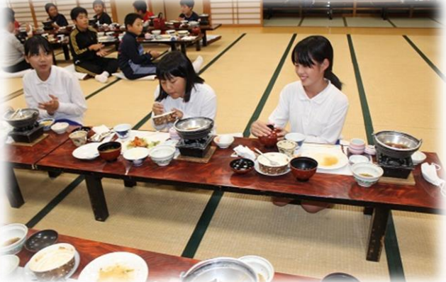
超豪華！食通一押しのホテルで振る舞われた「特上牛すき焼き会席」でまんぷく！