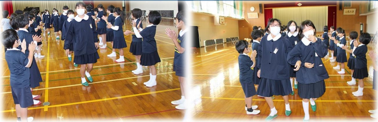
6年生から「〇〇さんはいい人だったね。」「1年生なのに凄い！」などの感想が…