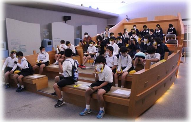
「土井ヶ浜遺跡人類学ミュージアム」(下関市豊北町神田上)で歴史勉強会